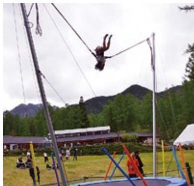
ハイパージャンパー

まるで無重力ジャンプ！ ハーネス、ゴムロープを付け、トランポリンで、自分の身体能力ではあり得ないほど高いジャンプを体験できます。慣