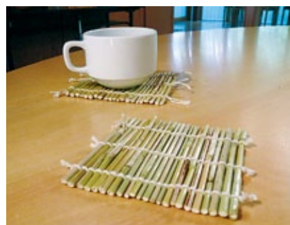
スキのコースター