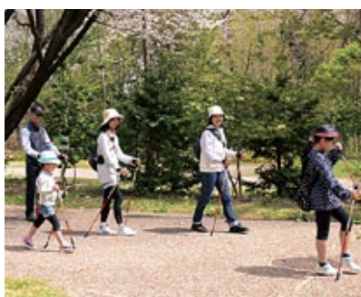
ノルディック・ウォーク

ノルディック・ウォークは、通常のウォーキングに比べて足腰の負担が少ない上、約4～5割増しのエクササイズ効