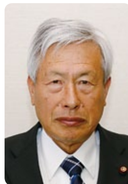
平林 英市 (68) 日本共産党 (海の口)