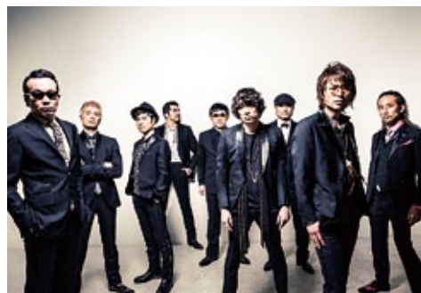
東京スカパラダイスオーケストラ

3月にオールタイムベストアルバム「The Last」の発売をもって一区切りをつけたスカパラが、満を持して全国ホールツアーを開催します。新たな気持ちで挑むスカパラが、このツアーで何を見せるのか。新生スカパラをお楽しみに!