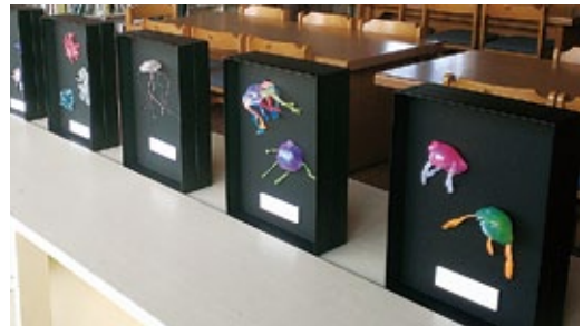
小さな命を観察して、樹脂粘土でつくろうワークショップ作品 制作：いわき市立好間第一小学校の児童