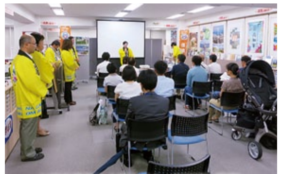
いなか暮らし大町セミナーIN東京 (6月)

また、総務省も東京に移住相談窓口「移住・交流情報ガーデン」を設置するなど地方への移住促進を活性化させています。