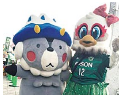
おおまびょんとガンズくん(6月27日 アルウィン)

動物の飼い主には、動物を適正に飼育する責任があり、自覚が求められています。動物の繁殖を希望しない場合は、不妊・去勢手術など繁殖制限の措置をとることもその一つです。不用意な繁殖で適正な飼育ができる頭数を越えた場合は、不幸な犬や猫が増える結果になってしまいます。 このような事態を未然に防止するために、長野県動物愛護会大北支部では、犬・猫の不妊・去勢手術費用の一部を補助します。