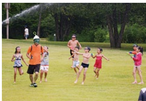
ウォーターモンスターを倒せ!