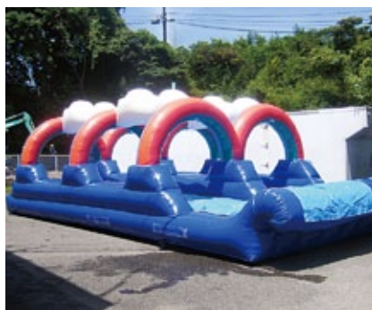
スリップスライド