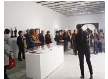
昨年の美術館めぐり

芸術文化振興事業の一つとして美術館巡りを開催します。大勢の皆さんのご参加をお待ちしています。