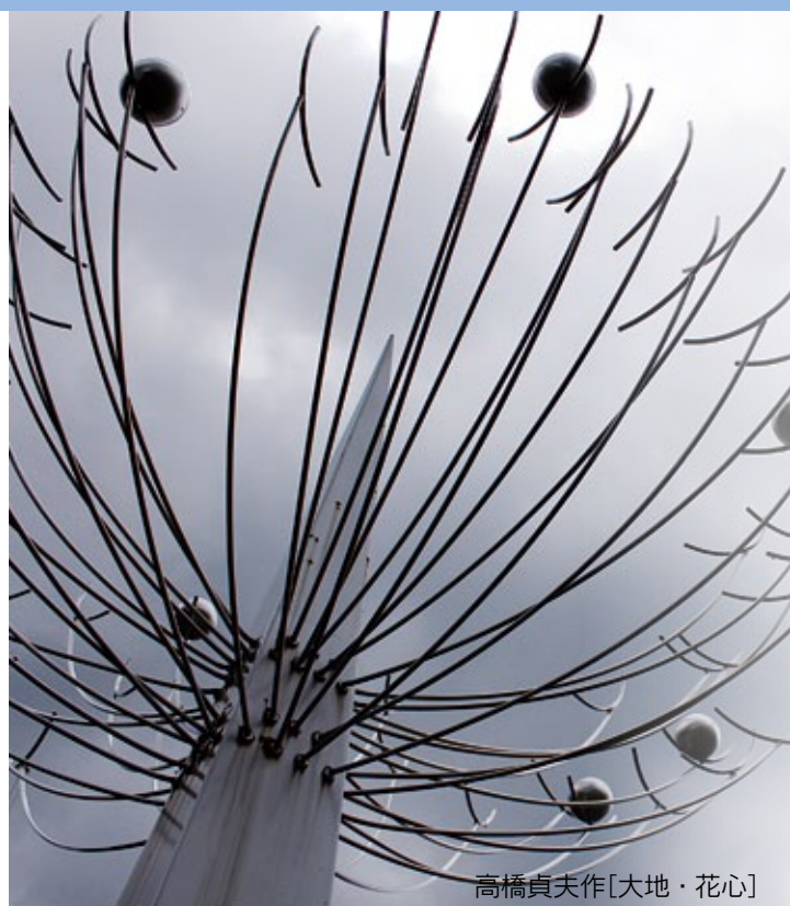
高橋貞夫作[大地・花心]

大町市には、歴史や風土、自然、産業、暮らしなど、地域に根差した特色ある多彩な文化資源が豊富にあります。