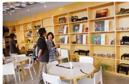
◀越後妻有里山現代美術館「キナーレ」にて マツシモ・バルトリニ feat. ロレンツォ・ピニ作 [Oin□]