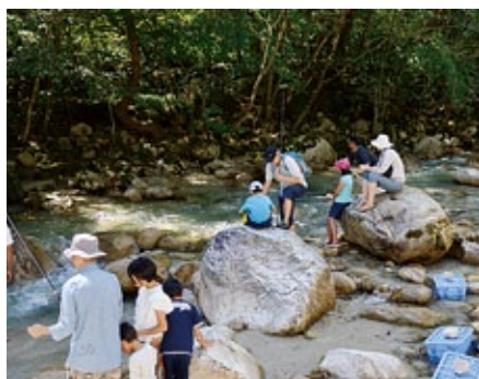
フィッシングガーデン

溪流ピクニック広場に管理釣り場がオープン。1日入漁証と釣り具レンタルで、手ぶらで溪流釣りが楽しめます。