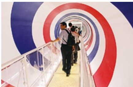
◀越後妻有里山現代美術館「キナーレ」にて カールステン・ヘラー作 [Rolling Cylinder, 2012]