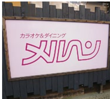
大町市大町(仁科町) TEL22-6617