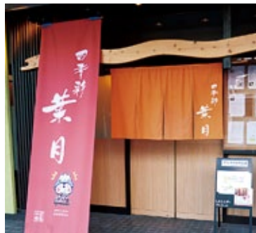
大町市大町(仁科町) TEL85-2557

■所在地：大町市大町3590-6 TEL23-2556 ■事業内容：運転代行業、飲食業、カラオケボックス