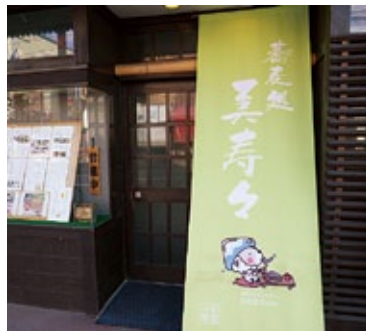
大町市大町(九日町) TEL22-2233