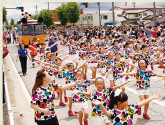
信濃大町まつり=6月6日 2年ぶりとなる東京ディズニーリゾート@スペシャルパレード開催などで中心市街地がにぎわう