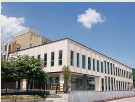
大町総合病院南棟「さくら」完成=7月1日 健診センターやレストラン、講堂を備え、大規模災害時には多数傷病者受け入れ施設となる