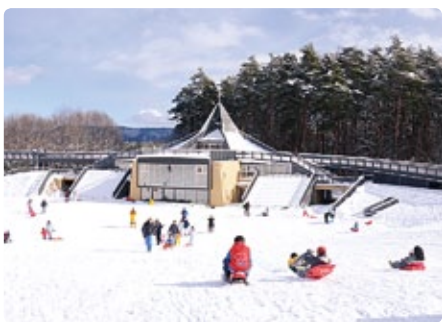
冬の公園で遊ぼう!

冬の公園は雪遊びの楽園に大変身! アルプス大草原とアルプス広場のそりゲレンデで、人気のスノーレーサーや