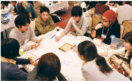
写真は信濃大町 Youth サミットの様子(26年12月)