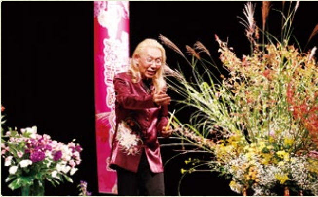
信濃大町恋華めぐり2015=9月23日