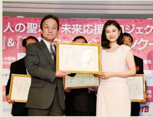
「恋人の聖地」観光交流大賞受賞=4月20日 全国約200カ所の「恋人の聖地」の中で大町市の取り組みが最優秀となる大賞を受賞