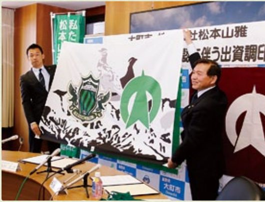
松本山雅へ出資調印 ホームタウンに=5月26日 5番目のホームタウンになり、市内で練習試合や子ども向けサッカー教室などを開催