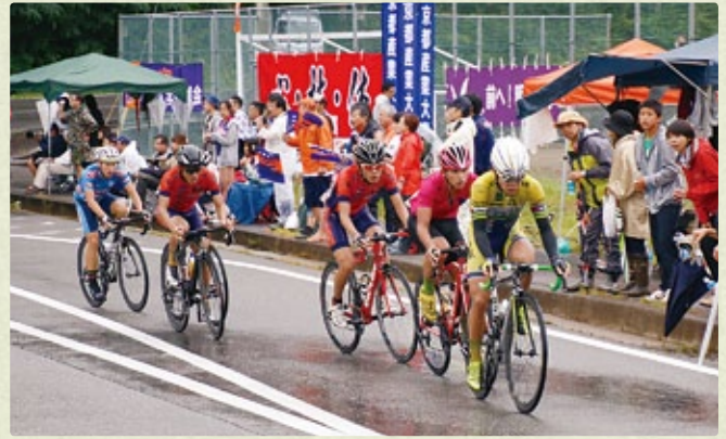
2015大町美麻サイクルロードレース大会=8月30日

恒例の美麻地区の自転車競技大会。ことしは全日本大学対抗選手権自転車競技大会が開催された