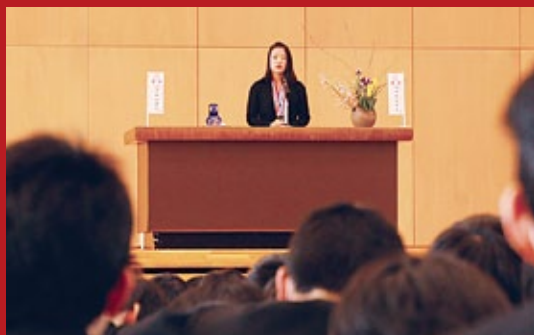
母校仁科台中学校では全校生徒404人を前に自分の経験や後輩たちへのメッセージを講演