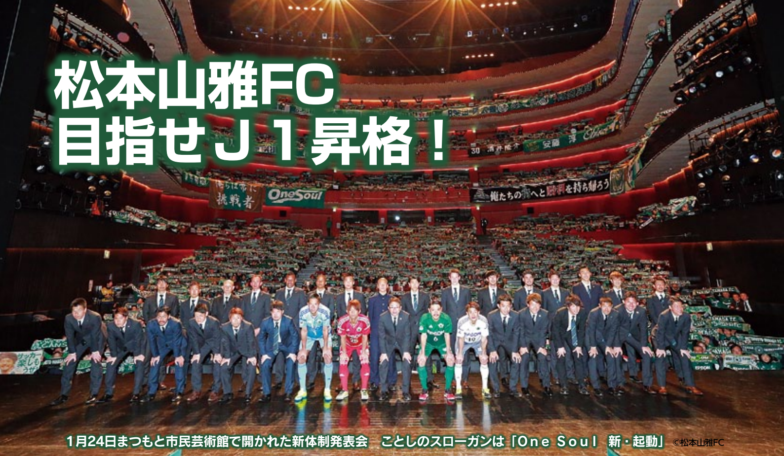
1月24日まつもと市民芸術館で開かれた新体制発表会 ことしのスローガンは「One Soul 新・起動」