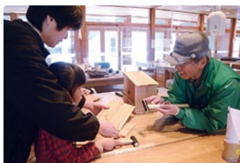
公園サポーターの活動風景

国営アルプスあづみの公園大町・松川地区では、各種体験プログラムで活躍する「公園サポーター」を募集します。灰焼きおやきや竹巻パンなどを作る食体験、小枝の工作やサンドアートなどのクラフト体験、四季折々の動植物を案内する自然観察などのプログラムで参加者の体験をサポートします。感謝の言葉が多く寄せられる、やりがいあるボランティア活動です。