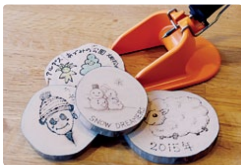
ウッドバーニング