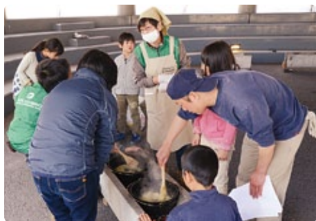
ダッチオーブン体験

ダッチオーブンを使った本格アウトドア料理を体験。グループに分かれて、全員でシェアする料理を作ります。