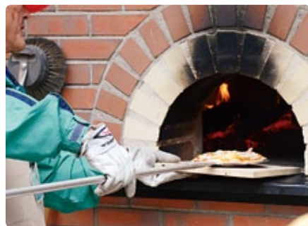
ピザ窯で焼く米粉ピザ

県内産の米粉を使いピザ生地を作り、旬の食材をトッピングしてピザ窯で焼く本格的なピザです。出来上がったピザは「モチモチ」「アツアツ」。昼食やおやつにはどうで