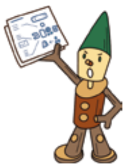
あづみのファクトリー

6月もアルプスあづみの公園に、ぜひお出掛けください。 ■問い合わせ アルプスあづみの公園管理センター (大町・松川地区) Tel 21・1212