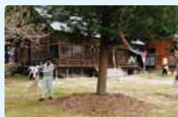
地元・森自治会の皆さんと清掃活動