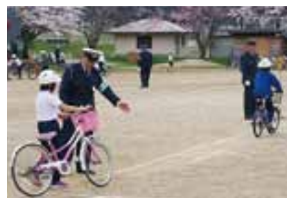
自転車の乗り方を指導