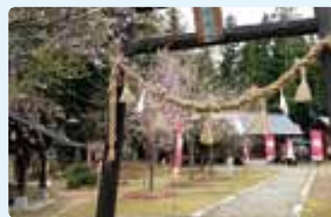
森城址～仁科神社の広い境内

「掃除に始まり掃除に終わる」という言葉がありますが、芸術祭も後片付けまでしっかりとやるのが、成功に結びつくのだらうと感じた一日でした。(本山裕久)