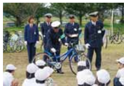
東小学校にて交通安全教室