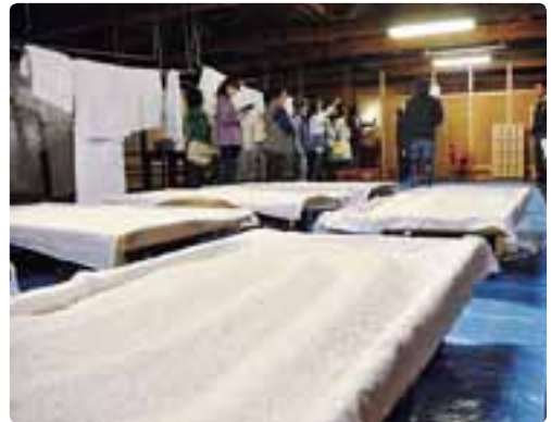
昨年のツアー「北安醸造(株)」

※第2回・第3回のツアーや信濃おおまち達人検定の詳しい内容は、以降の広報おおまちでお知らせします。