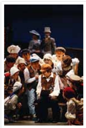
これまでの公演より

世界的な童話作家アンデルセンの青春の物語。ミュージカルとクラシックバレエが一つになり、劇団四季の表現力を存分に楽しめる作品です。