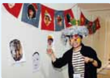
芸術祭いよいよ開催！