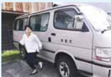
大きな車も運転できるようになりました