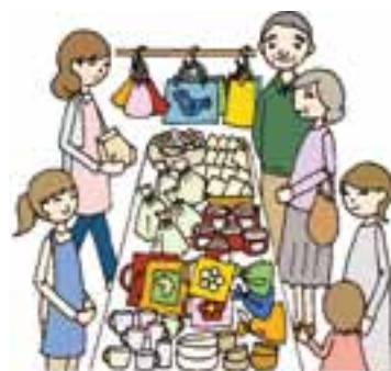
クラフトバザール