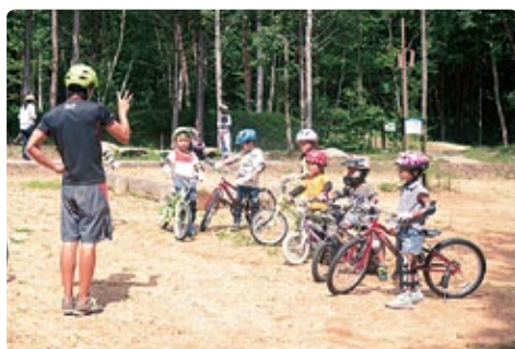
自転車安全スキル教室

タイヤの太さがMTBの2倍以上の自転車「ファットバイク」に乗ってみませんか。 ■日時 10月21日(土) 午前9時30分～11時30分、午後1時～4時 ■場所 入口広場 ■対象 身長130cm以上で自転車に乗れる人