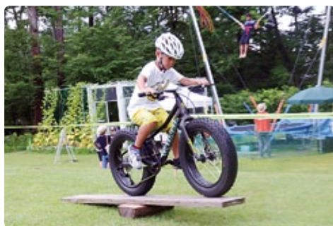
ファットバイク体験