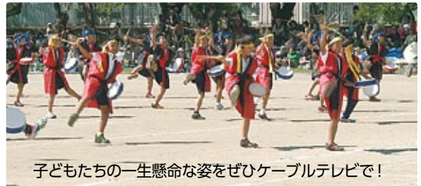
子どもたちの一生懸命な姿をぜひケーブルテレビで!