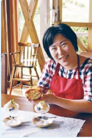
ブルーベリーとミントを添えた豆乳アイス