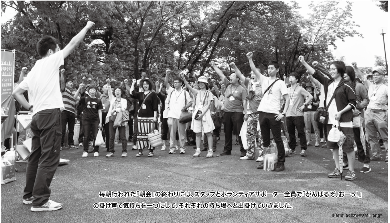
毎朝行われた「朝会」の終わりには、スタッフとボランティアサポーター全員で「がんばるぞ、おーっ！」の掛け声で気持ちをつにして、それぞれの持ち場へと出掛けていきました。