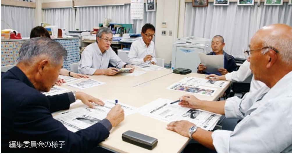
編集委員会の様子