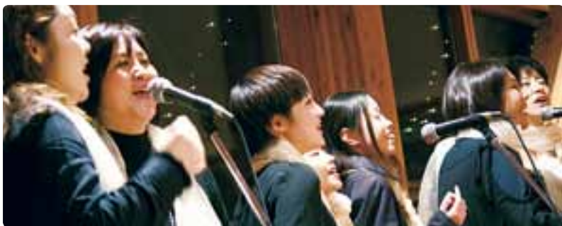
NAGANO Lovefellowship Gospelchoir