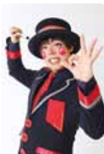
魔法使いアキット