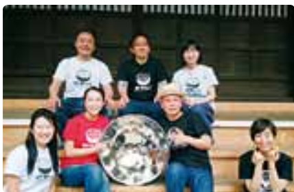
Pine Tree Steel Pan Band

◇12月17日(日) スティールパンコンサート 「Pine Tree Steel Pan Band」