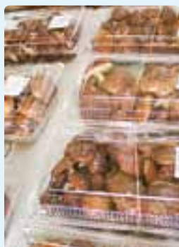
自慢のきのこ。この日販売されていたのはリコボウ