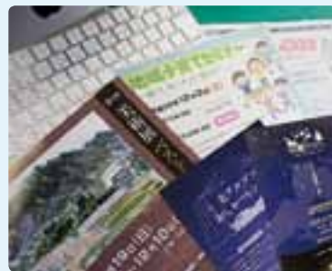
手掛けた「チラシ」たち目にさせていただけたでしょうか