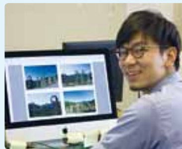
「北アルプス国際芸術祭記録集」制作のため日々作業に奮闘中