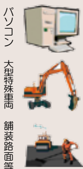
パソコン 大型特殊車 舗装路面等

申告期限は、30年1月31日(水)までです。期限間近は大変混雑します。提出は、お早めにお願います。