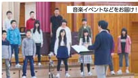
音楽イベントなどをお届け!