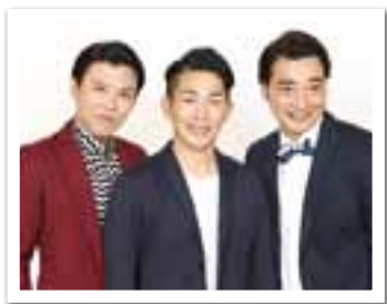
ジャングルポケット

よしもとお笑い生ライブを開催！ テレビなどでおなじみの豪華出演者による漫才・コントなど“生の笑い”を存分にお楽しみください。