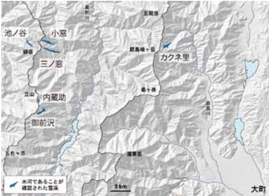
調査団のデータに基づく北アルプスで氷河と確認された雪渓 (地形は国土地理院陰影起伏図)

北アルプスの6つの氷河には共通して、25m以上の分厚い氷があることがわかりました。その結果、傾斜にもよりますが氷体の厚さが約25m以上になると自らの重さで谷筋