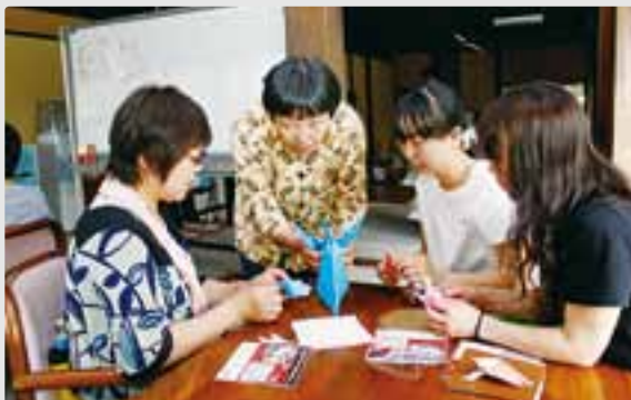
北アルプス国際芸術祭でのワークショップの様子