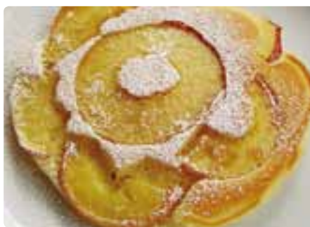
花まるパンケーキ