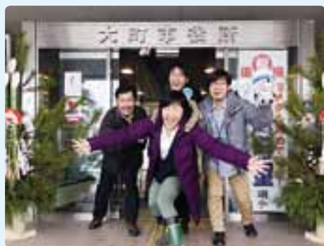
大町が大好きなわれら協力隊 これからもよろしく申し上げます