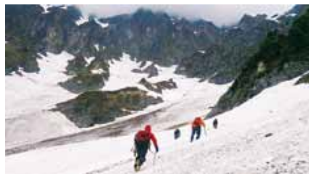
カクネ里雪溪への到達には高度な技術と体力が求められる

門員で、信州大学の小坂共栄 特任教授が就任しました。調 査は、平成26～28年度の3年 間にわたって行い、研究論文 (※1)が、日本地理学会の『地 理学評論』1月1日号に掲載 され、氷河であることが公式 に認められました。