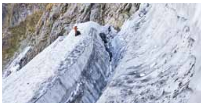
クレバス調査は危険を伴うため安全を確保して、雪氷層の断面を観察する

ところが、2012年に立 山連峰で3つ、そして今年に カクネ里のほか、立山連峰の 池ノ谷雪溪、内蔵助雪溪が氷 河として公式に認められ、北