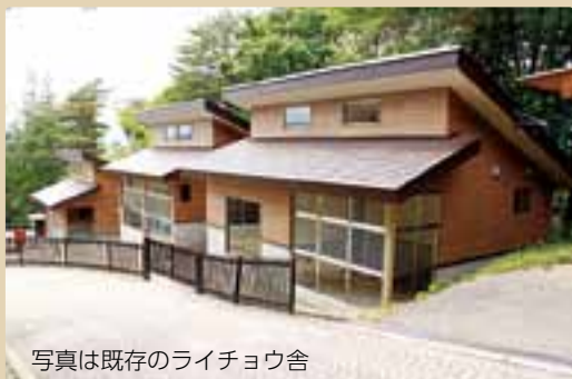
写真は既存のライチョウ舎

山岳博物館付属園は3月末まで休園し、新たなライチョウ舎を建設中です。現在、ニホンライチョウは飼育や繁殖を優先し一般公開していません。4月から既存のライチョウ舎で近縁種のスバルライチョウを見させていただくことができます。