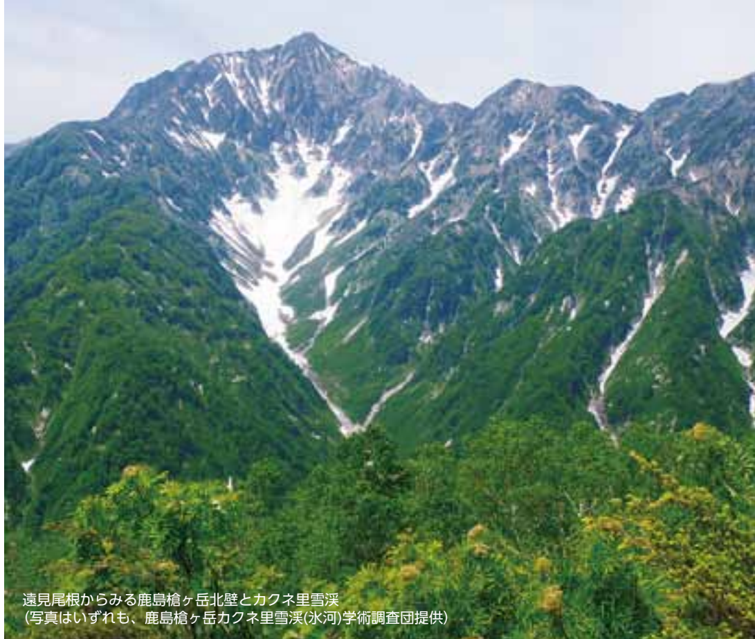
遠見尾根からみる鹿島槍ヶ岳北壁とカクネ里雪溪