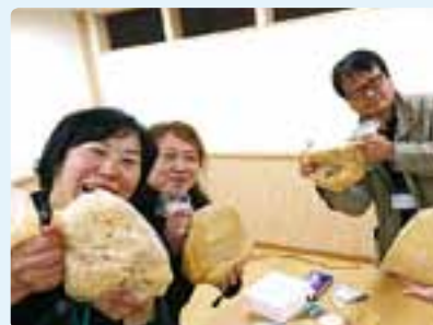
皆さんもみそ造り体験してみてください(要予約、詳細はマルコメへ)