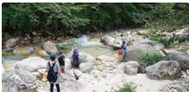
フィッシングガーデン