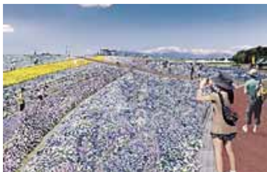
【北アルプスと花の丘】 皆さんと協働で作る15万株の大花壇

来年の春、信州スカイパークをメイン会場として、第36回全国都市緑化信州フェア「信州花フェスタ2019～北アルプスの贈りもの～」を開催します。全国都市緑化フェアは、長野県では初めてとなる国内最大級の花と緑のイベントです。500品種50万株の花々がメイン会場を彩ります。