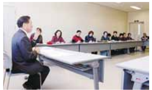
まちづくり行政懇談会

団体やグループとの「まちづくり行政懇談会」、自治会との「地域懇談会」では、市長が直接、皆さんからのご意見・ご提案をいただいています。市の将来のため、ご参加をお願いします。