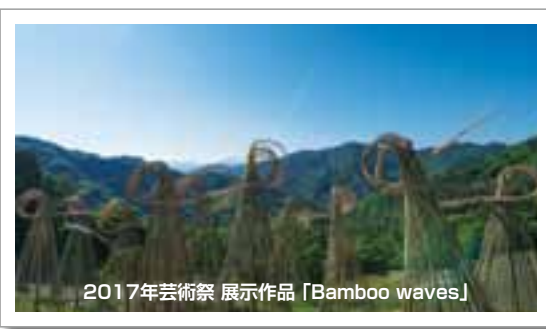
2017年芸術祭 展示作品「Bamboo waves」