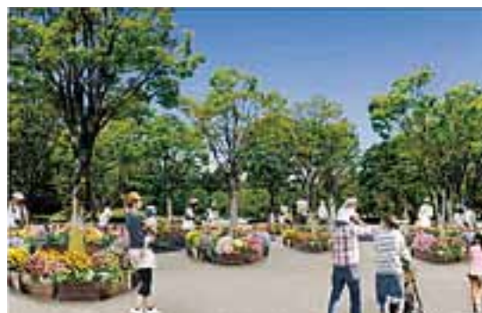
【出会いの広場】 色彩豊かな花々で来場者をお出迎え