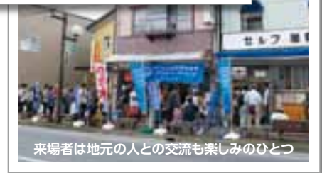
来場者は地元の人との交流も楽しみのひとつ