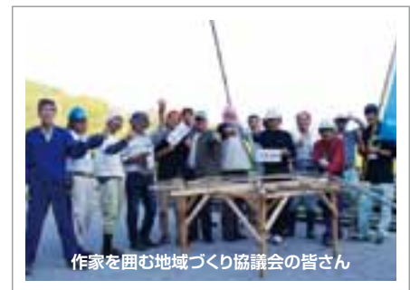
作家を囲む地域づくり協議会の皆さん

昨年の芸術祭、八坂地区の「バンブーウェーブ」の制作では、八坂地域づくり協議会の皆さんの全面的なサポートにより、材料の竹の切り出しから制作まで作家と共に取り組んでいただきました。そして、会期中の来場者へのおもてなしは大変好評でした。また、中心市街地の「セルフ屋敷2」では、入場を待つ来場者とのコミュニケーションやおもてなしなど積極的に関わっていただく姿がありました。来場された皆さんからは「作品も良かったが、地域の人とのコミュニケーションが楽しかった」「地元の人がここまで制作に参加しているのはすごい」など、地域の皆さんの取り組みへの賞賛や感謝の声が届いています。芸術祭を契機に、このような地域の皆さんの取り組みの輪が広がり、地域の元気や活力再生につながればと考えています。