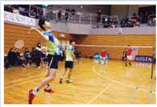
北アルプスバドミントンオープンを初開催 =1月5日~8日 奥原希望さんの活躍を記念した初の国際大会に国内や海外3カ国から延べ約500人が出場