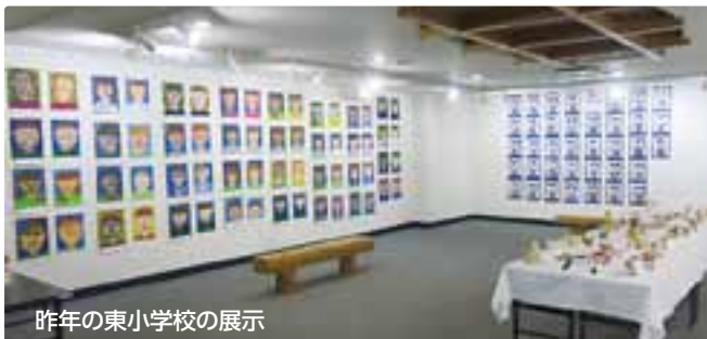
昨年の東小学校の展示

市内の児童・生徒が授業やクラブ活動で制作した作品を展示します。入場無料です。この機会に、子どもたちの感性豊かな作品をぜひご覧ください。