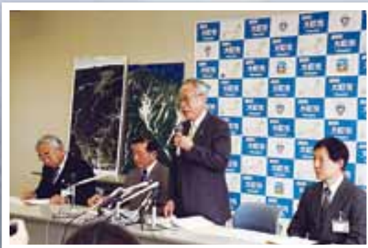
鹿島槍ヶ岳カクネ里が県内初の氷河と学術的に認められ記者会見=1月18日 学会誌に氷河であると掲載されたことを受け、カクネ里雪渓(氷河)学術調査団が記者会見