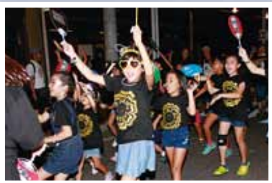
第40回大町やまびこまつり=8月4日 市街地中央通りで鼓笛隊や太鼓、ダンスなどのほか、夜の踊りには59連・約2500人が参加