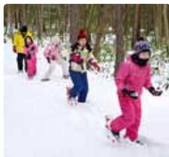
スノーシューウォーキング