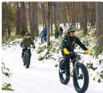
アドベンチャーサイクリング