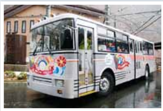
立山黒部アルペンルート全線開通=4月15日 来シーズンからの電気バス運行を前に関電トンネルトロリーバスラストイヤーがスタート