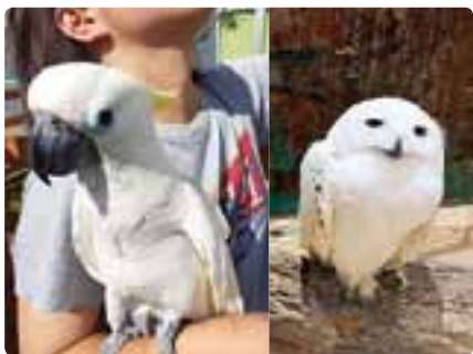
冬のふれあい動物園