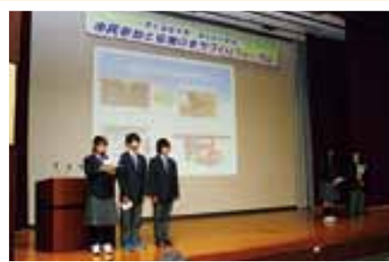
市内中学生による地域学習の発表