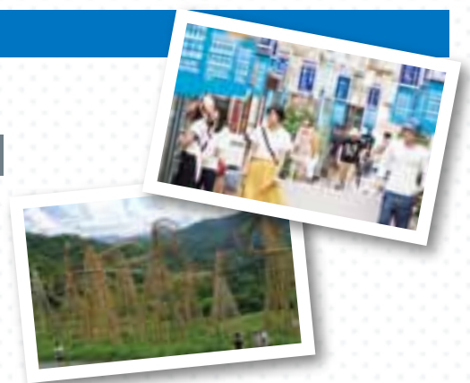
2017年の開催では多くの人が大町市を訪れました