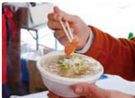
けんちん汁の振る舞い