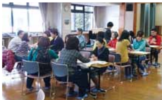
昨年の交流会の様子