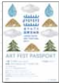
2017年芸術祭のチケット

来場者が使いやすく、多くの作品を鑑賞していただけるような利便性の高いチケットを検討します。