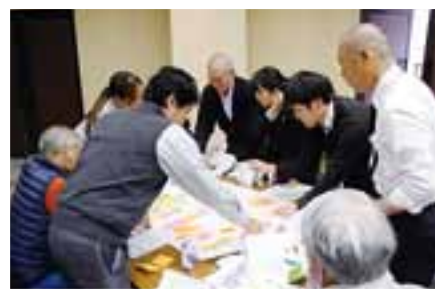
世代を超えて話し合ったワークショップ