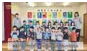
市内年長園児が 将来の夢を 元気なポーズとともに!