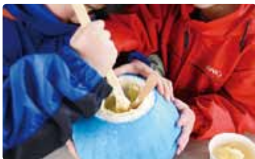
ココロアイスクリーム

と、アイスクリームの出来上がり! 雪に塩を混ぜると温度が下がる現象を利用して、楽しみながらアイスクリームを作ります。今回は特別数量限定トッピング付です!