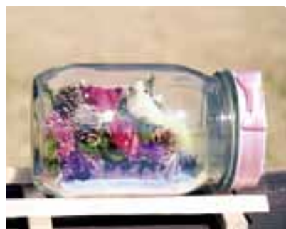
フラワーボトル教室