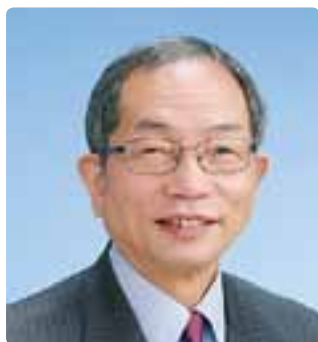
宮田 一男(65) 日本共産党(笹尾)