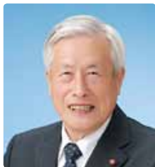
平林 英市(72) 日本共産党(海の口)