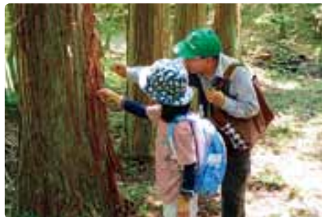
いきものの森探検隊