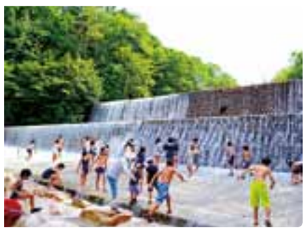
スプラッシュ・リバー