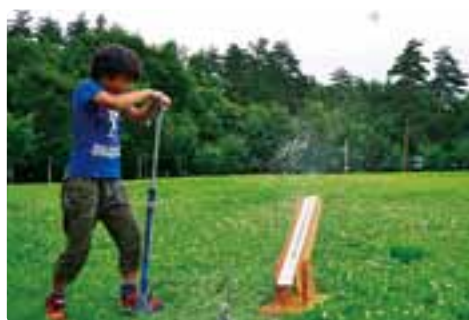
ペットボトルロケット