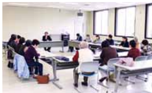
まちづくり行政懇談会

団体やグループとの「まちづくり行政懇談会」、自治会との「地域懇談会」では、市長が直接、皆さんからのご意見・ご提案をいただいています。市の将来のためご参加をお願いします。