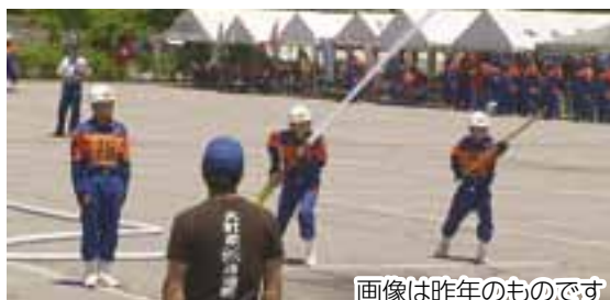
画像は昨年のものです

*まるごと信州情報ネット..... 1日～31日 *東小学校 音楽会..... 3日～ 9日 *八坂小学校 音楽会..... 10日～16日 *メンドシーノ交流..... 24日～30日 *定例記者会見..... 26日・27日