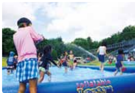
スプラッシュ・ランド