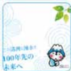
啓発用コースター