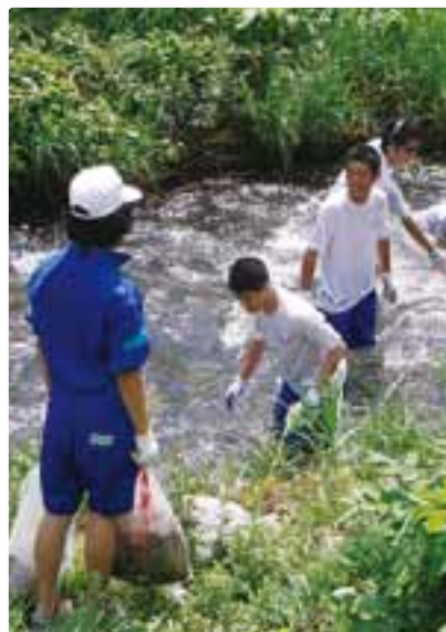
第一中学校農具川河川敷ごみ拾い

水を学ぶことにより、清らかな水環境を整備し、未来へつなげる必要性や、「水を守る」意識の高揚を図る。