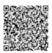
電子申請サイト QRコード

■問い合わせ 生涯学習課生涯学習・青少年係 Tel 圏内線622 〒398-8601 大町市大町3887