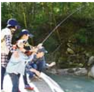
フィッシングガーデン

※釣れない場合、2匹まで補償、調理(塩焼き)1000円/匹、魚の追加300円/匹