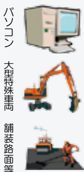
パソコン 大型特殊車 舗装路面等

申告期限は、令和2年1月31日(金)までです。期限間近は大変混雑します。提出は、お早めにお願います。