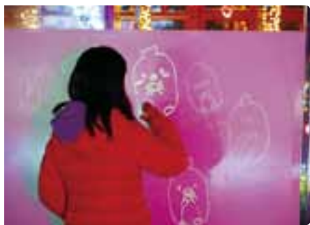
光のお絵かきキューブ