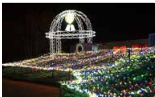
イルミネーション

【大町・松川地区】と【堀金・穂高地区】同時開催の冬のイルミネーションイベントを今