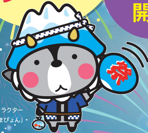
大町市キャラクター 「おおまびょん」

※おどり連の配置については、7月16日（木）に大町市役所で開催の代表者会議の際に抽選を行います。併せて「うちわ」等の配布をいたします。