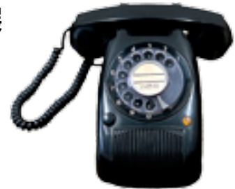
昭和時代に使われていた 有線電話機 (スピーカー一体型)