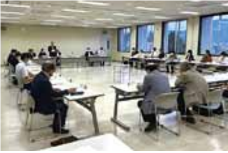
第1回小学校再編準備委員会の様子

第1回準備委員会では「大町市学校再編基本計画」に定める小学校再編の概要について、改めて内容を確認いただきとともに、準備委員会で協議する主な検討事項や新校開校に向けてのスケジュールなどを確認しました。