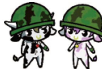
自衛隊長野地方協力本部 公認キャラクター 「しんちゃん」「なのちゃん」

防衛省では、自衛官や自衛官を目指す学生などを募集します。 詳しくは、自衛隊長野地方協力本部ホームページをご覧ください。 お問い合わせください。