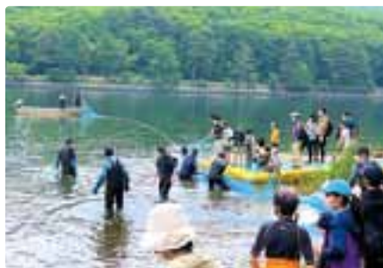
木崎湖地引網と水上トレッキング