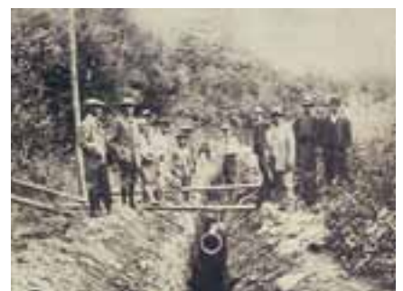
水源地配水池間工事

これを背景に、市街地に井戸を掘ることを試みましたが、当時の技術では良質な水脈を見つけることができませんでした。そこで、この地域ならではの「湧き出すこと」を考え、「湧水」を利用することを考え、大正の時代になって水源調査が行われることとなり、候補地として挙げられた中で、水質、水量や経費などの点から居谷里水源が最適候補地となりました。 当時は居谷里水源を利用する水利組合の専用とされ、農業用水として古くから使われていたことから、水道として