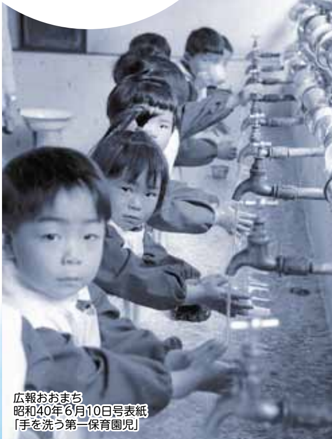
広報おおまち 昭和40年6月10日号表紙 「手を洗う第一保育園」