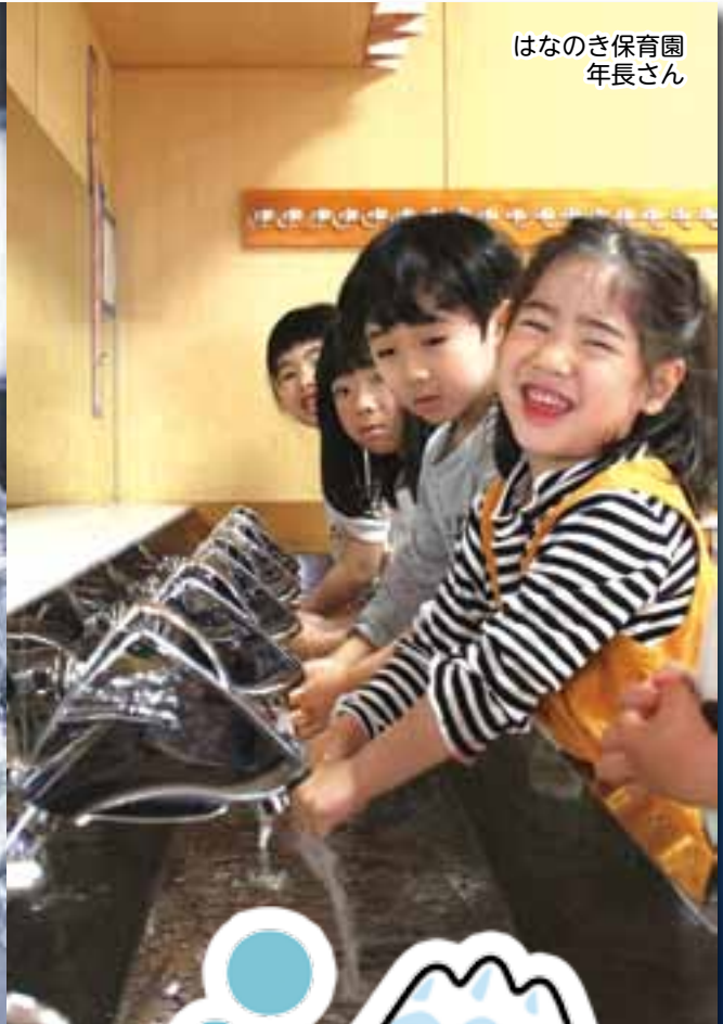
はなのき保育園 年長さん