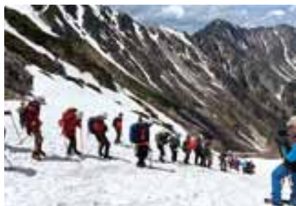
針ノ木岳慎太郎祭