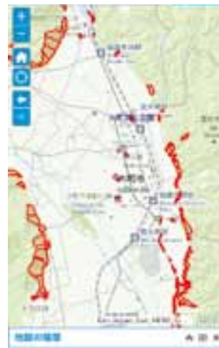
市防災マップ画面イメージ