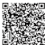
市ホームページ 土砂災害に備えて