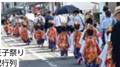
若一王子祭り 稚児行列