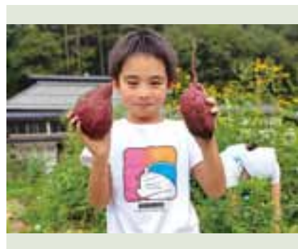
ひろげようまちづくり活動