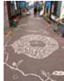
《全ては美しく繋がり返る》 信濃大町2014ー食とアートの廻廊ー

土、葉っぱ、道路用白線素材、テープなどを用いて絵画を制作。 昭和の面影を残す大町名店街の路上に描かれた作品。