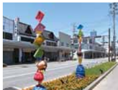
《私は大町で1冊の本に出逢った》 北アルプス国際芸術祭2017、2021

台湾のベストセラー絵本作家。 色鮮やかなイラストと詩的な物語で人気を集め、パブリックアートなども手がけている。 絵本は日本をはじめ、アジアから欧米まで20以上の言語に翻訳されている。