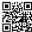
黒部ダム ホームページ

■問い合わせ 大町プロモーション委員会 TEL23-4081 平日午前9時～午後5時