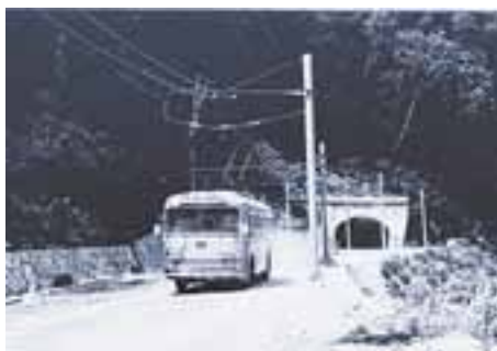
試運転する100型 (昭和39年7月)