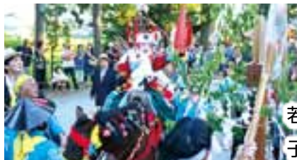
若一王子祭り 子ども流鏝馬