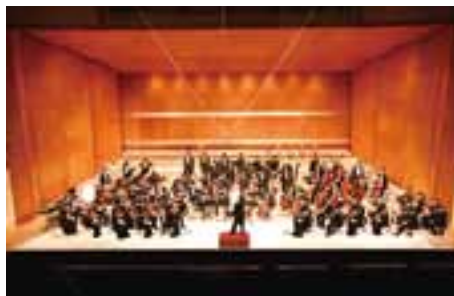
信州アルプス交響楽団

■曲目 モーツァルト／オーボエ四重奏 1楽章 ハイドン／弦四「ひばり」全楽章 ほか