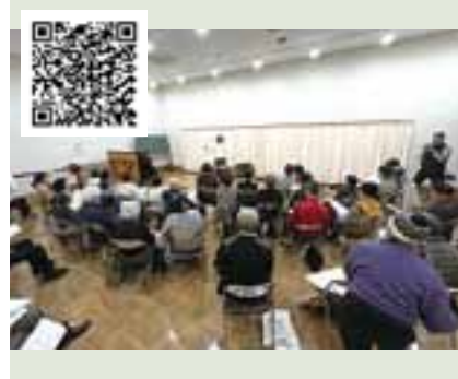
はじめようまちづくり活動