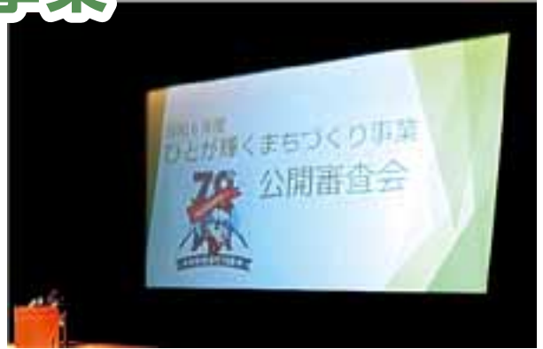
はじめようまちづくり活動