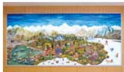
《自然の美しさと調和》 北アルプス国際芸術祭2021

マヤアーティスト。 大町に取材し描かれた連作の一つが山をテーマにした古書店「書籠アルプ」にて再展示される。