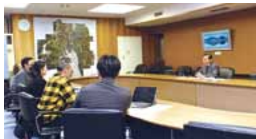
まちづくり行政懇談会

団体やグループとの「まちづくり行政懇談会」や、各自治会での「地域懇談会」も、市長が直接、皆さまからのご意見・ご提案をいただいています。市の将来のため、ぜひご参加をお願いします。