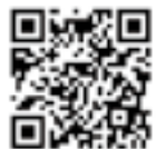
クラウドファンディング活動報告