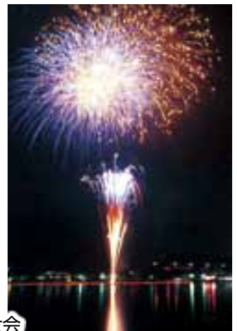
木崎湖 灯籠流しと花火大会