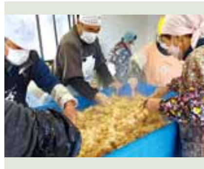
はじめようまちづくり活動