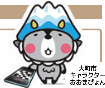
大町市 キャラクター おおまびよん