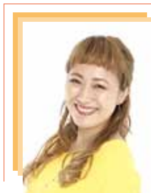
丸山桂里奈さん NHK Eテレ 「すくすく子育て」など 多数出演中!

※1：かかりつけ患者のみ ※2：大町市民のみ *掲載に同意している医療機関のみ掲載しています。