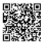
国税庁 チャットボット 「ふたば」

令和7年1月1日現在、大町市に住所があり、次の「市民税・県民税の申告が必要な人」のいずれかに該当する人は、市民税・県民税の申告が必要です。ただし所得税の確定申告をする人は除きます。