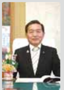
大町市長 牛越 徹

あけましておめでとうござい ます。輝かしい新年の年頭に当 たり、市民の皆様のご健勝とご 多幸をお祈り申し上げます。