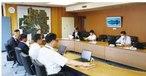
8月29日の第1回委員会

市政に対する信頼を大きく損ねたことを、深くお詫び申し上げます。 市ではこのことを受け「大田市官製談合防止等対策検討委員会」を設置しました。 この委員会は、市の顧問弁護士、県大町建設事務所長、市公共工事等入札契約監視委員会会長の外部有識者と市の部長で構成されています。 8月29日の第1回検討委員会では、市の入札制度の現状