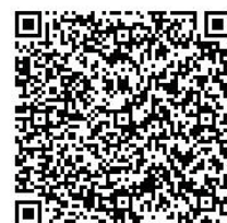
普通救命講習会 電子申請