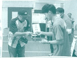
信州ブリリアントアリーズ