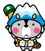
大町市キャラクター おおまびよん