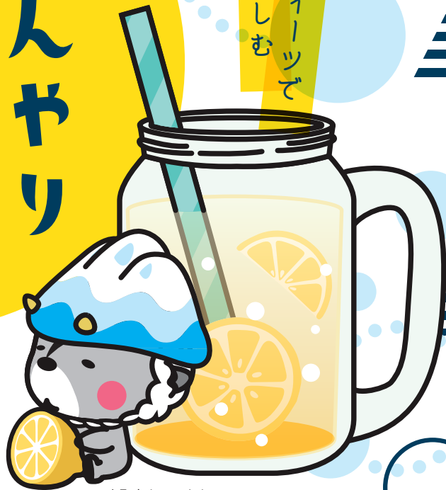
大町市キャラクター おおまびよん