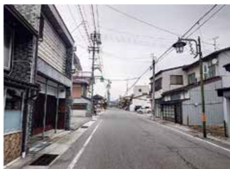
次代へ繋ぐ街なみ環境整備事業。第一歩として整備が始まる五日町

Q 民間の知見やスピード感を市の課題解決に生かすため、企業版ふるさと納税の「人材派遣型」を活用し、専門家を庁内に迎え地方創生の推進力として導入していく考えは。 A 実質的な財政負担なしで民間の専門人材を任用でき、市役所庁内