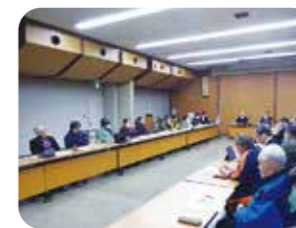
大町・平・常盤・社地区参加者13名