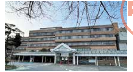
市立大町総合病院