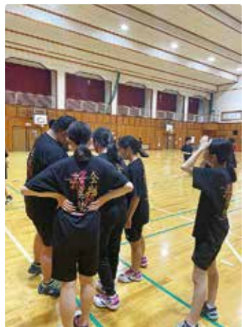
子どもたちの「やりたい、楽しみたい」をどう叶えていくのか