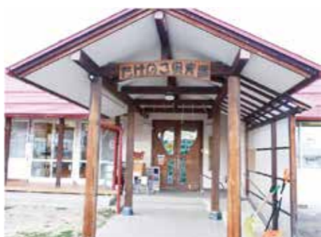
八坂地域全体で子育てを応援している「たけのこ保育園」

受け止め、あり方検討会で方向性を示したい。 災害時のトイレ確保は急務 Q 災害時のトイレ確保計画は。 A 市独自の計画はないが、国や県が示す基準に基づいて、簡易トイレ等の備蓄を計画的に進めている。 Q 災害に備えて、家庭での携帯トイレの備蓄を進めると共に学習する機会を設けることが必要では。 A 広報での周知と避難所開設訓練等の機会を通じて行う。