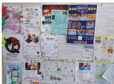
サークル活動がさかんな平公民館

Q 公民館の減免率の改定はいつ頃を予定しているのか。 A 令和9年4月の予定である。 Q 使用料を負担していただかなければ、維持管理できないのか。 A そうではない。 Q 公共施設の原点、本質に沿って市民が納得される条例改定にしたい。 A 学校、社会教育は、すべての方々に「学ぶ機会」をつなげることを提供していくのが教育行政の大事な部分である。広い視点で検討していく。