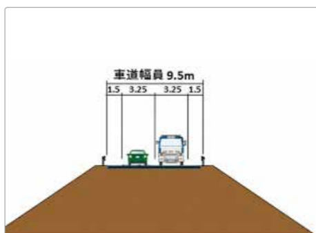
土地の買い上げまでに10年もかかれば高齢者は再出発できない

Q 昨年12月の松糸道路の発表と同時に道路隣地の売買は減り、明らかに取引価格も安くなり流動性そのものが悪くなっている。該当の市民に対して固定資産税の減額を検討すべきだ。「70歳を過ぎた高齢者にとっていつ土地建物の買い上げがあるのかわからない中、80歳過ぎてからの引っ越しや生活の立て直しは、大変不安だ」との声もある。長野県には希望する市民に対して土地の買い上げを早めてあげられるように進言してもらいたい。