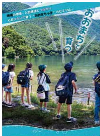
各地区の魅力を活かした、子育て・移住施策等の重要性は高まる