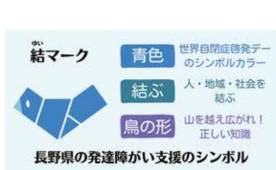
長野県の発達障がい支援のシンボル、「結マーク」

A 伊那市などの先進事例を参考に検討を進める。 Q 精神障がい者の支援においては、専門的知識がなければ正しい支援につなげることは難しく、むしろ悪化させてしまうことさえ危惧される。ぜひ、専門職または経験豊かな人材の配置とともに、人材育成の強化を求めます。 A 現在、市には専門職はいないが、福祉事務所としては組織的な対応により相談・支援に努める。