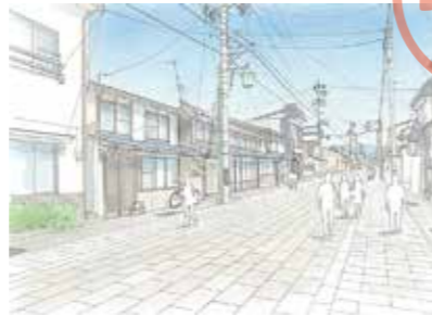
五日町通りを美装化（イメージ図）