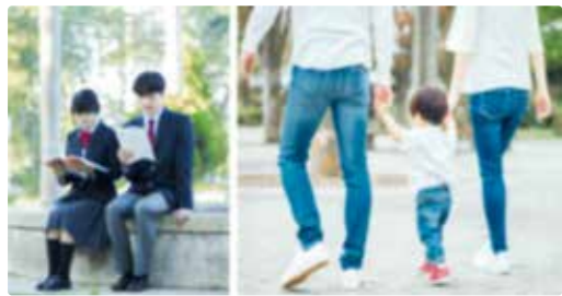
若者世代が大町に戻り、家庭を築くことができる取組が絶対に必要

A 現状では増額は検討していない。子育て施策全体のバランスや持続性等を考慮しながら、出産・子育て支援の充実に取り組んでいきたい。