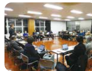
八坂地区参加者19名