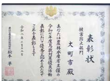
令和7年度鳥獣対策優良表彰

Q 有害鳥獣対策は。 A 農業被害の二ホンザル対策はICT技術により捕獲数が増え、被害額は3分の1に減っているが、二ホンジカによる被害額、生息数が増加しており、被害防除対策や個体調整を複合的に実施する。国の重点支援地方交付金で、有効な支援策となるよう、市として検討する。