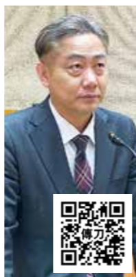
峻嶺会 傳力 健