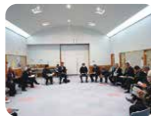
美麻地区参加者10名