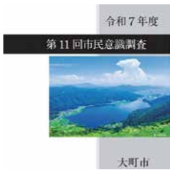
令和7年度 第11回市民意識調査 大町市 20年ほど前の第7回から改善していない項目が数多く目立つ