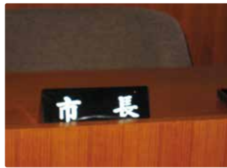
真の再発防止には、市民目線に立った真相究明が不可欠だ

A 捜査権も何一つない行政において、これ以上の説明は不可能であり、行わない。関係事業者に対する調査を実施したが解明につながる内容は承知していない。